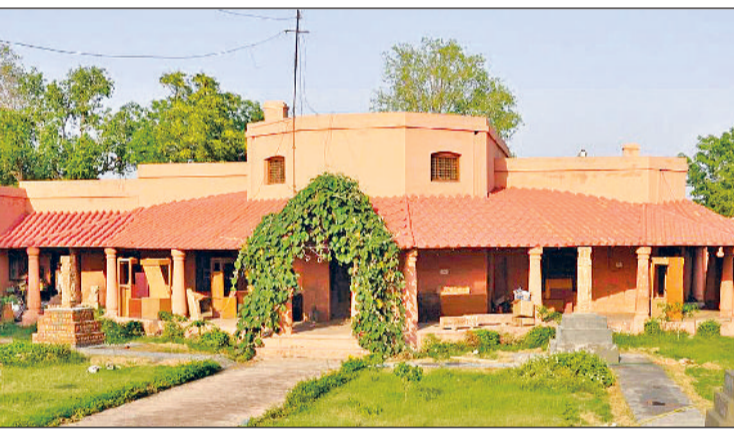
हिसार स्थित जॉर्ज कोर्टी जो जॉर्ज थॉमस का निवास स्थान थी, इसे वर्तमान में जहाज कोर्टी के नाम से जानते हैं। हांसी के प्राचीन किले के अवशेष जहां जॉर्ज ने अपने राज्य की राजधानी स्थापित की।

जार्ज पर धावा बोलने का आदेश दे दिया। लेकिन तब तक जार्ज थॉमस एक बड़ी सेना गठित कर चुका था। वह हांसी के किले में तोपे बनाने का कार्य कर चुका था। उसके तीन और स्थानों झज्जर, जहाजगढ़ तथा हांसी में पर्याप्त युद्ध सामग्री का संग्रह हो चुका था। मराठों तथा जार्ज दोनों की सेनाओं में यूरोपीय कमांडर नियुक्त थे। जनरल पैरो फ्रान्स देश का वासी था। अन्ततः वार्ता आदि के विफल रहने पर मराठा सेना ने लुईस बैरकीन के नेतृत्व में जार्ज के गढ़ जहाजगढ़ पर सितम्बर 1801 में आक्रमण कर दिया। जनरल पैरो स्वयं झज्जर तक आया तथा मरे खां नामक अधिकारी को झज्जर का प्रशासक बनाया गया। फिर बैरकीन व स्मीथ की सेना ने भारवाच शली तथा माजरा गांव के पास कैम्प किया। उधर जार्ज भी हांसी का चार्ज रोहिला बटालियन को सौंपकर जहाजगढ़ किले में पहुंच गया और सितम्बर के अन्तिम सप्ताह