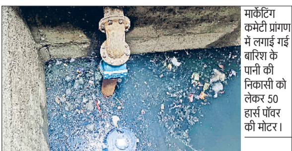
मार्केटिंग कमेटी प्रोग्राम में लगाई गई बारिश के पानी की निकासी को लेकर 50 हार्स पावर की मोटर।

विधायक द्वारा मंडी से बारिश के पानी की निकासी का पुख्ता प्रबंध करते हुए यहां पर पानी निकासी को लेकर लगाई गई 25 हार्स पावर की मोटर की जगह 50 हार्स पावर की