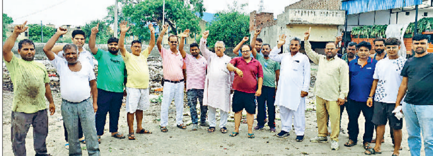
जींद। रोष जताते दुकानदार।

नरवाना की सब्जी मंडी को समस्याओं की मंडी कहा जाए तो कोई अतिशयोक्ति नहीं होगी। सब्जी मंडी में सफाई व्यवस्था चरमराई हुई है लाइट रहती नहीं पीने के पानी के लिए कोई उचित व्यवस्था नहीं है। जिसको लेकर आदतियों ने