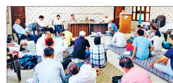
कैथल। अध्यापक नेता कर्मचारियों को संबोधित करते हुए

माध्यमिक शिक्षा विभाग हरियाणा की तरफ से मई में 20 पंजाबी अध्यापकों के पंजाबी प्रवक्ता के पद पर पदोन्नत किया गया था। उसके बाद अन्य विषयों पदोन्नति सूची जारी हुई थी। अन्य सभी विषयों के पदोन्नत प्राध्यापकों को लिंक जारी करके पोर्टल के माध्यम से मेरिट अनुसार स्टेशन दिए गए लेकिन पंजाबी के पद पर पदोन्नत अध्यापकों को इसमें शामिल नहीं किया गया। विभाग द्वारा अध्यापकों से बिना कोई स्टेशन की चाँदिस मांगे