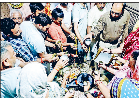
जींद। जयंती देवी मंदिर में भगवान शिव की पूजा करते श्रद्धालु।

हर-हर महादेव के जयकारों से मंदिर परिसर गूंज उठता है। सोमवार को मंदिर में भगवान शिव के रुद्राभिषेक के लिए श्रद्धालुओं ने दूध, दही, शहद, गंगाजल और घी से शिवलिंग का अभिषेक किया जाएगा और सुख व समृद्धि की कामना की जाएगी। सोमवार को