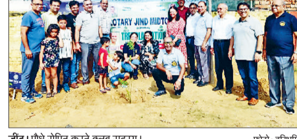
जींद। पौध रोपित करते वलब सदस्य।

उचाना। उचाना कलां के पार्क को जाने वाली गली में भरे गंदे पानी से आवागमन करने वालों के साथ-साथ यहां स्थित मंदिर, पार्क में आने-जाने वालों को परेशानी का सामना करना पड़ता है। बिना बारिश के भी यहां पर कई दिनों से पानी भरा हुआ है। वार्ड के लोग एवं राहगीरों द्वारा कई बार मांग सिर से गली निर्माण की मांग की जा रही थी। बाबा रामधन वाला मंदिर में श्रद्धालु भी इस रास्ते से आते-जाते हैं तो पार्क में भी यहां से लोगों का आना जाना रहता है। मंदिर की तरफ जाने वाले प्रमुख रास्ता होने के चलते यहां से आवागमन सबसे अधिक रहता है। गंदे पानी से होकर ही लोगों को आना जाना पड़ रहा है।